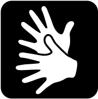
Deutsche Gebärdensprach- dolmetscher