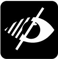
Zugang für Menschen mit Sehbehinderung