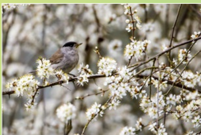
Lebensraum Gehölz, Mönchsgrasmücke