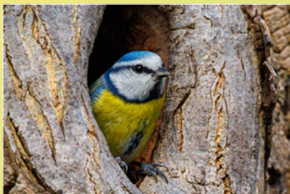
Blaumeise in Baumhöhle